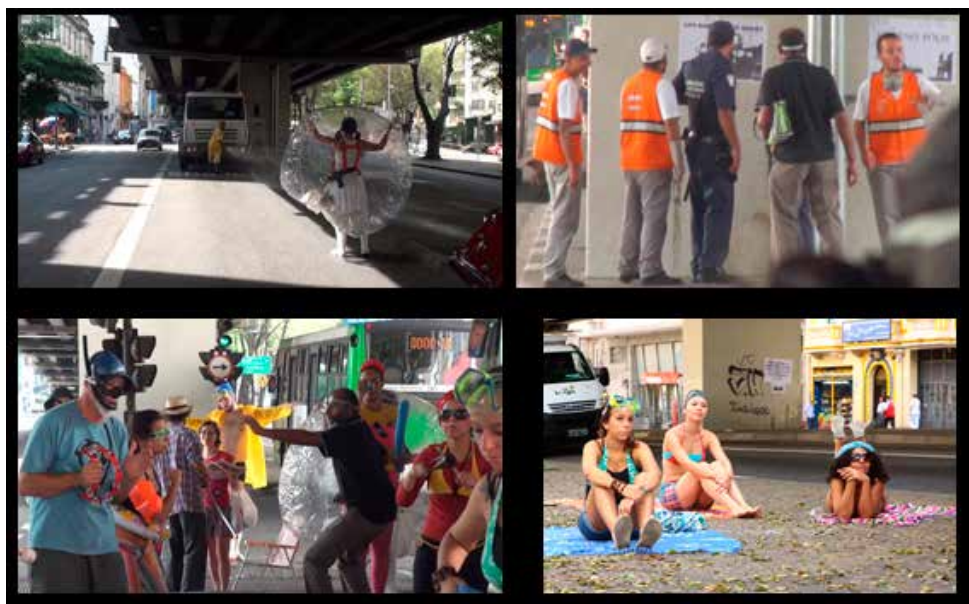
Acervo Coletivo do Mapa Xilográfico. Intervenção Bloco do Pipa, Santa Cecília, São Paulo, 2011.

Nesse contexto, o Mapa Xilográfico propôs a criação do Bloco do Pipa 14 , uma intervenção que carnavalizou e buscou enfrentar simbolicamente a naturalização de uma política estatal de natureza higienista. Um grupo de banhistas, trajados de pés de pato, óculos de mergulho, boias, pranchas e demais elementos relacionados a um banho público, foram ao encontro do caminhão pipa em ação.