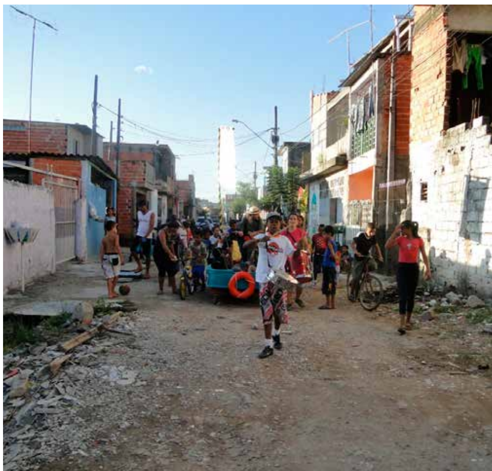
Acervo Coletivo do Mapa Xilográfico Intervenção O Barco, Jardim Helena, Jardim Pantanal, São Paulo, 2011.

Após o recuo das águas, o Mapa Xilográfico convidou integrantes da comunidade para a vivência do Coletivo Fluído, resultando na criação da intervenção O Barco. Construído pelos moradores do Jardim Pantanal com peças do ferro velho local, o barco zarpou pelas ruas do bairro. Em seu convés, fones de ouvido com as diferentes narrativas dos fundadores do lugar, dividindo com as crianças seus saberes e suas experiências de resistência, em busca do direito à cidade. Ao longo da navegação, atracamos em diferentes “portos”, convidando moradores para entrar na embarcação e dividir seus saberes. Um carro emparelha, buzina e seu motorista bem humorado afirma: “precisava de um desses em janeiro passado”. A subversão do alagamento planejado como acontecimento de resistência e valorização das histórias de luta por moradia. Memória, experiência, poesia e enraizamento como contranarrativa do processo de expulsão.