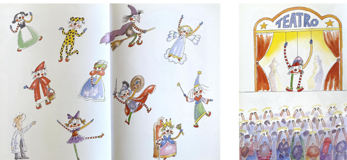
Figura 5 - Trecho do livro As aventuras de Bambolina . Fonte: Iacocca (2006).