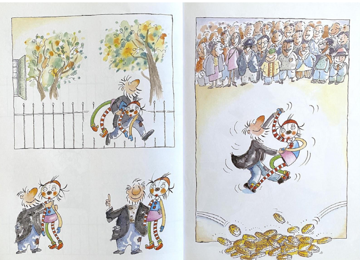
Figura 2 - Trecho do livro As aventuras de Bambolina .