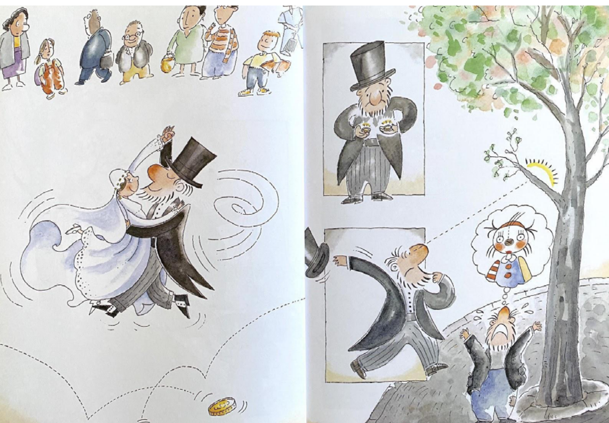
Figura 3 - Trecho do livro As aventuras de Bambolina .