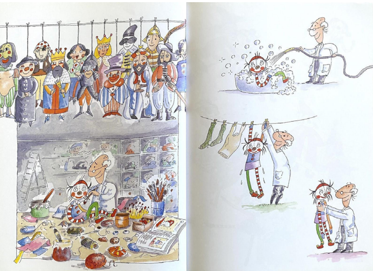
Figura 4 - Trecho do livro As aventuras de Bambolina .