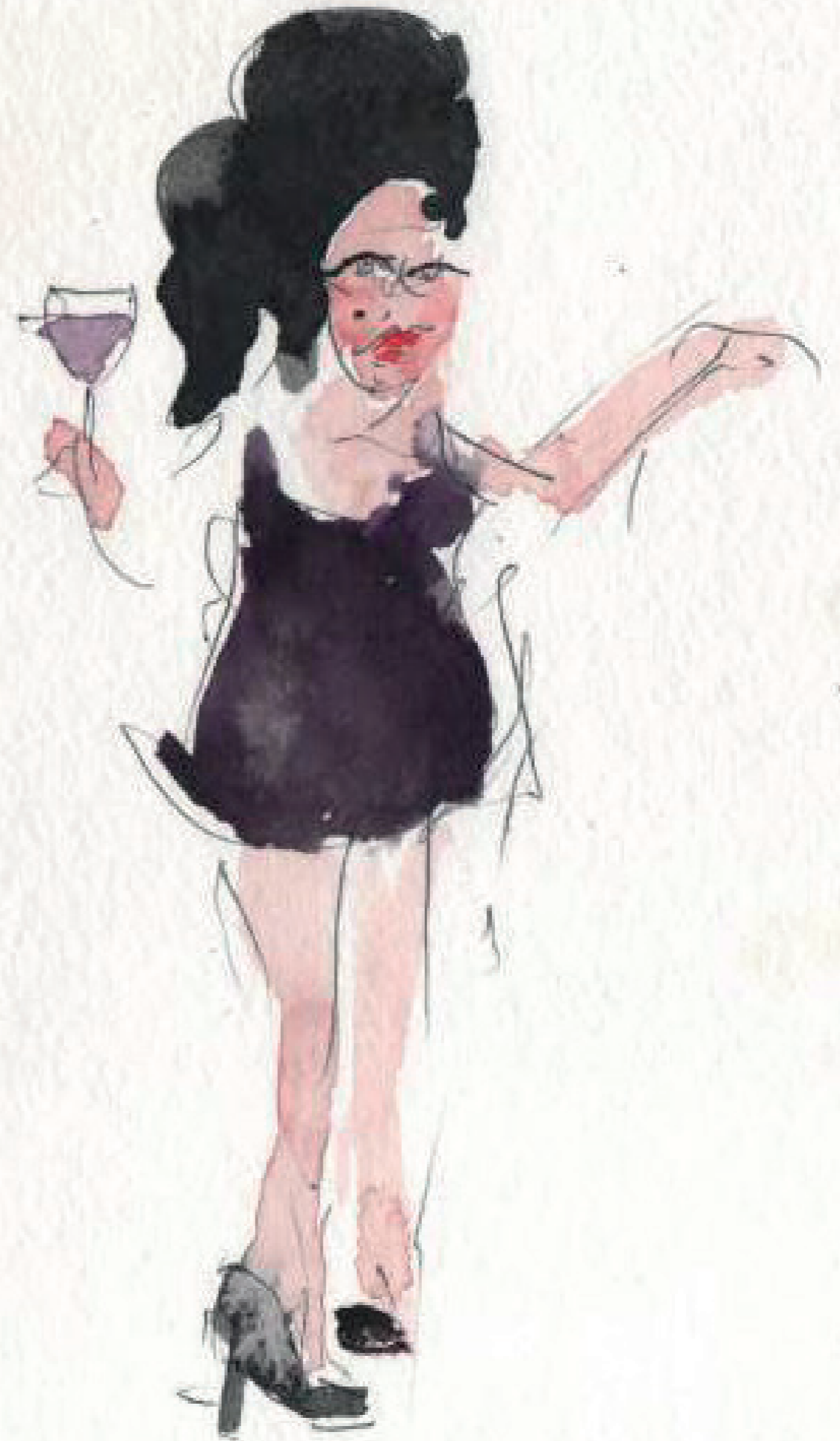
Manuêla Antropofagia 12/11/2014