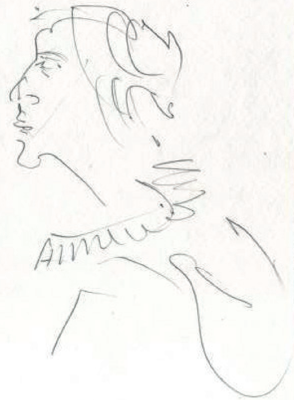
Maurício Antropofago 12/2001 218 Rebento, São Paulo, no. 16, Jan-Jul 2023