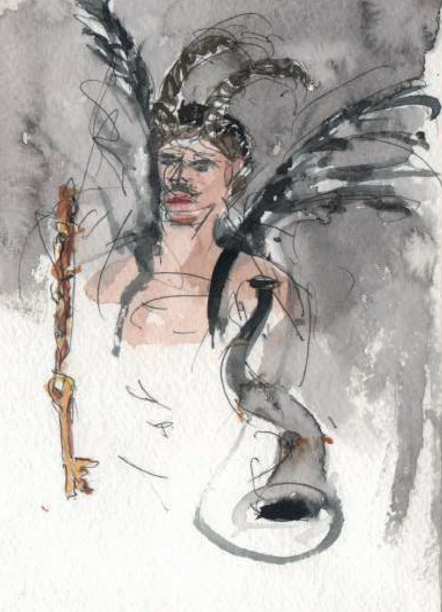
maamba Antropologia 12/11/2021 223 Rebento, São Paulo, no. 16, Jan-Jul 2023