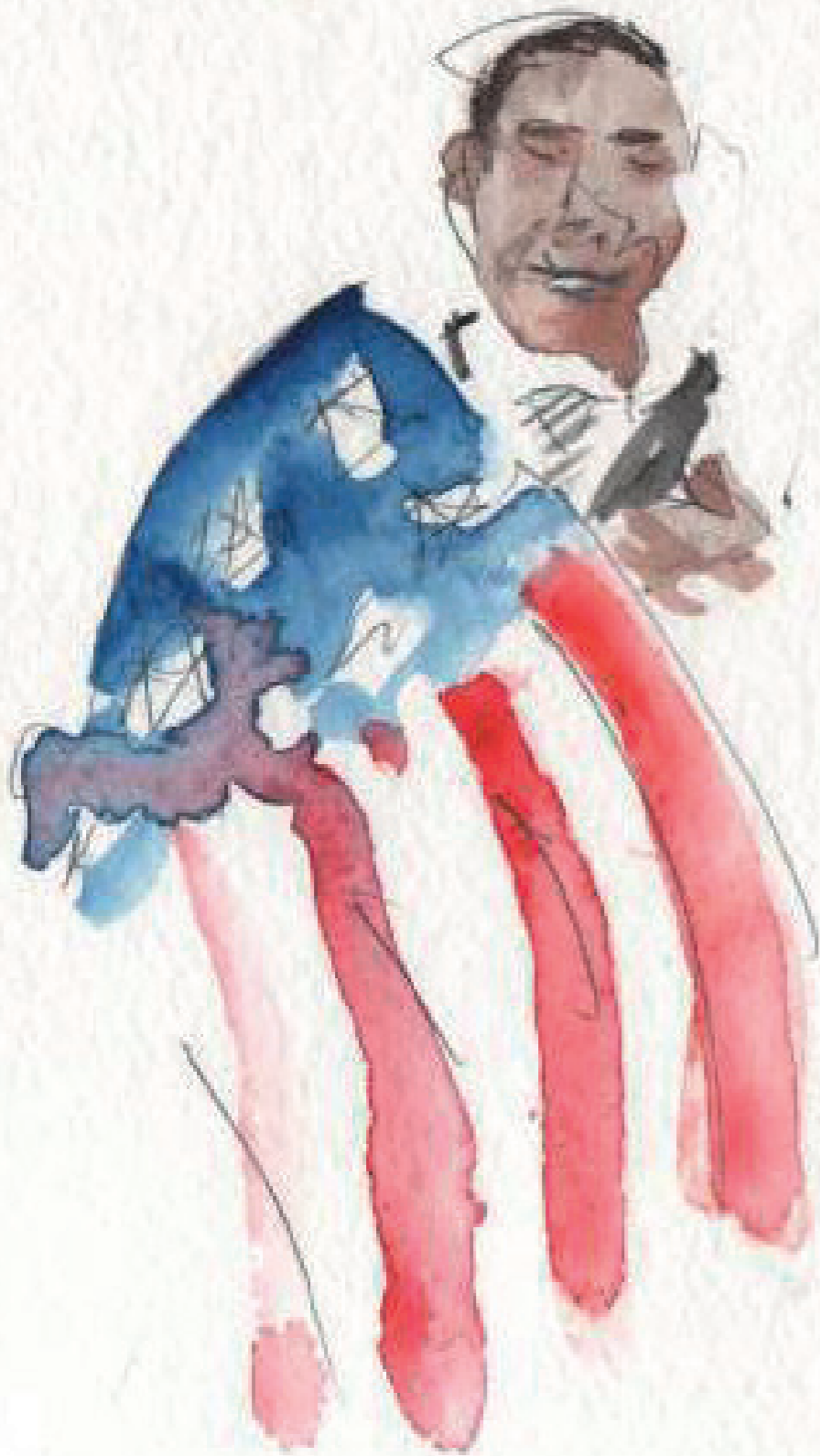
Manuêla Antropofagia 12/11/2014