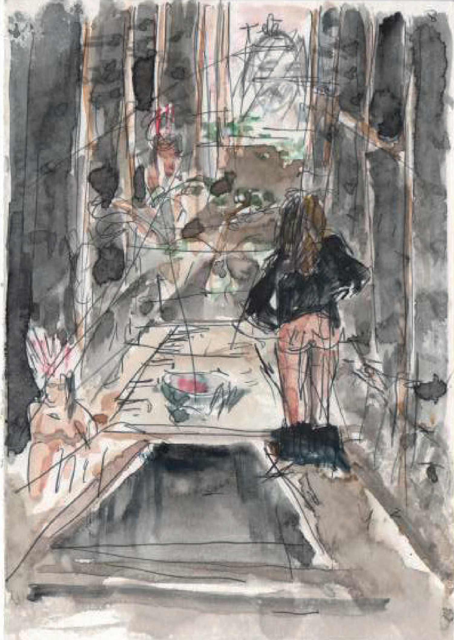
maianha Anta-pitaya 12y 2011 Rebento, São Paulo, no. 16, Jan-Jul 2023