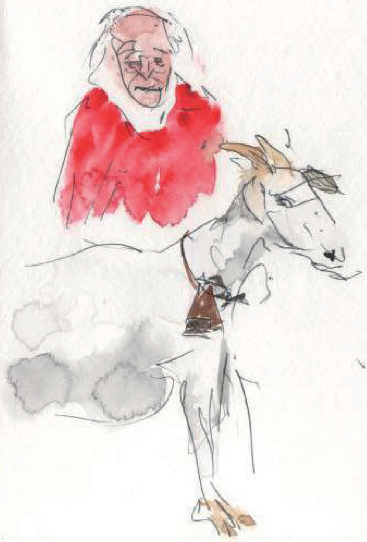
Maurício Antropofago 12/2001 217 Rebento, São Paulo, no. 16, Jan-Jul 2023