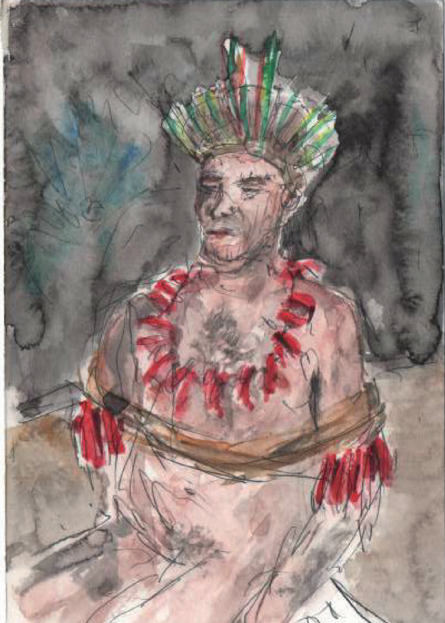
maianha Anta-pitaya 12y 2011 Rebento, São Paulo, no. 16, Jan-Jul 2023