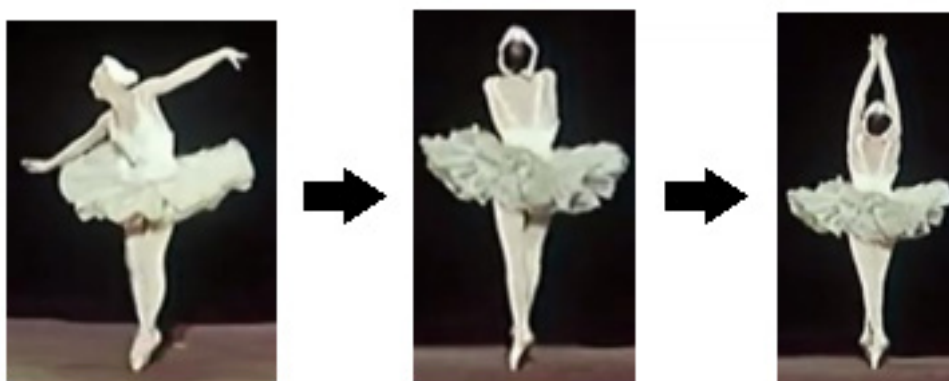
Fig. 10 – Trajetória em direção ao fundo do palco e gesto de tensão localizado sobre a dominante do c. 17 (elaborado pelos autores, 2021).

A mesma sequência de ações repete-se na frase subsequente, sobre uma construção musical idêntica na região do bVII tonicizado (c.12-13). Na sequência, a bailarina retoma uma vez mais o agora instável bater de asas e com uma breve pausa no movimento de bourrée gera impulso para o ponto de maior tensão harmônica da peça: a preparação para a retomada da melodia inicial: sobre o momento em que ocorre a mistura modal supracitada, o V^{(b3)} encaminhando-se para o V, a dançarina move-se para o fundo do palco, posiciona-se de costas para o público e lentamente levanta seus braços até que eles alcancem o ponto mais alto em todo o balé (Fig. 10).