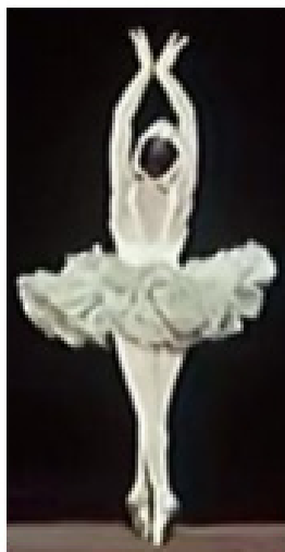
Fig. 11 – Movimento de relaxamento dos pulsos sobre a retomada do tema inicial (c.18) (elaborado pelos autores, 2021).

Este movimento conecta-se com a retomada do motivo principal da coreografia: as asas do cisne. Mais lento, como que para dissipar aos poucos a energia acumulada, este motivo dá lugar ao mesmo giro executado no início da peça, o qual, prevendo a nova tensão que se seguirá, cresce em andamento e na extensão do alcance dos braços para chegar ao c. 21, onde presumir-se-ia que ocorreria o tombé sobre o I, como ocorreu sobre o final da primeira escala ascendente da peça. Porém, este I é substituído aqui por um V/IV que, através de um movimento descendente do baixo dá lugar a um V/II, ambos localizados exatamente sobre a nota primária, o que gera um ponto de grande estresse; e o que antes foi um tombé , aqui torna-se um espaço para um grande crescendo do movimento de giro (Fig. 12).