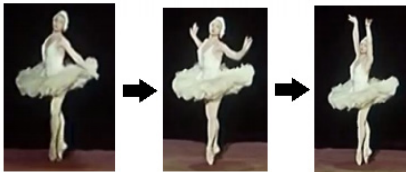
Fig. 6 – Movimento inicial da coreografia de A Morte do Cisne (c. 2-3 e 6-7) (elaborado pelos autores, 2021).

Crescendo em tensão em direção ao c. 4 – em um jogo entre os níveis estrutural e profundo da harmonia, um I encaminhando-se para um II – neste momento da coreografia percebemos a construção de uma trajetória para um ponto de tensão moderada atingido no c. 4, exatamente sobre o V, quando a bailarina executa um movimento de giro (Fig. 7)