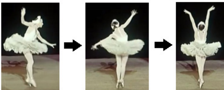
Fig. 9 – Movimento instável dirigido a ataque realizado sobre os acordes dominantes dos c. 11 e 13 (elaborado pelos autores, 2021).

A parte B inicia com um ponto de trajetória onde o movimento dos braços se instabiliza para em seguida atingir o alto em um ataque sincronizado com o ponto de tensão moderada localizado sobre o V (c.10-11) (Fig. 9).