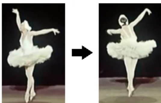
Fig. 7 – Movimento de giro executado durante trajetória para resolução harmônica (c. 4 e 8) (elaborado pelos autores, 2021).

Crescendo em tensão em direção ao c. 4 – em um jogo entre os níveis estrutural e profundo da harmonia, um I encaminhando-se para um II – neste momento da coreografia percebemos a construção de uma trajetória para um ponto de tensão moderada atingido no c. 4, exatamente sobre o V, quando a bailarina executa um movimento de giro (Fig. 7)