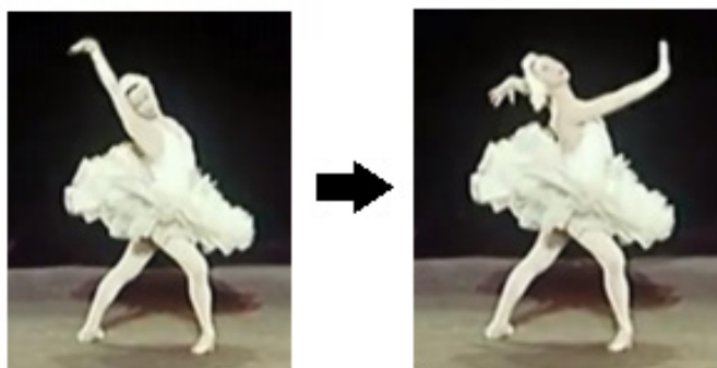
Fig. 8 – Tombé realizado concomitantemente às resoluções harmônicas dos c. 5 e 9 (elaborado pelos autores, 2021).

que resolverá em um tombé 15 (Fig. 8), o primeiro ponto de relaxamento, localizado sobre o retorno ao I e sobre a nota primária da linha fundamental (Si 4 , grau melódico 3).