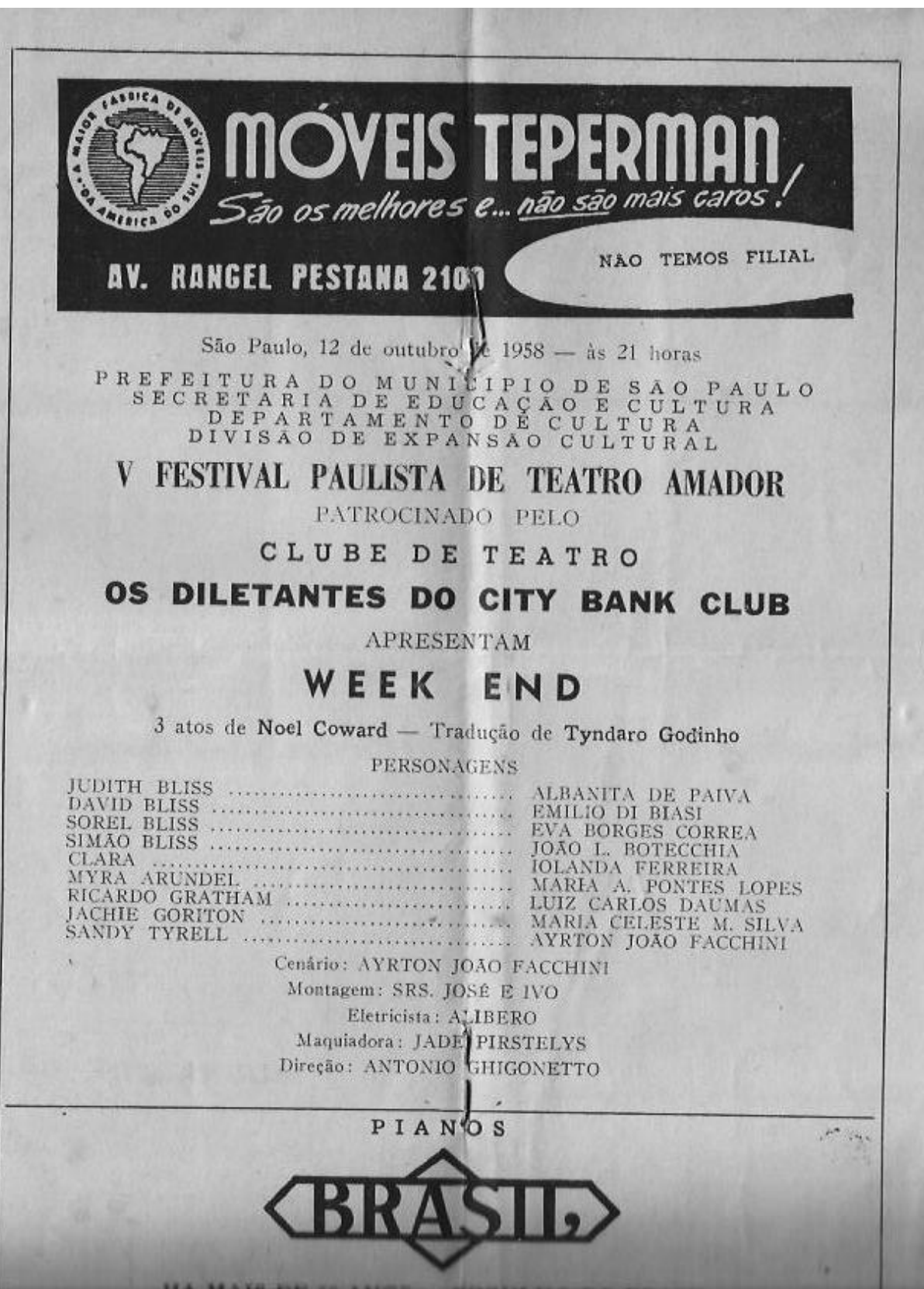
Fig. 5 - Programa do V Festival Paulista de Teatro Amador, em 1958.