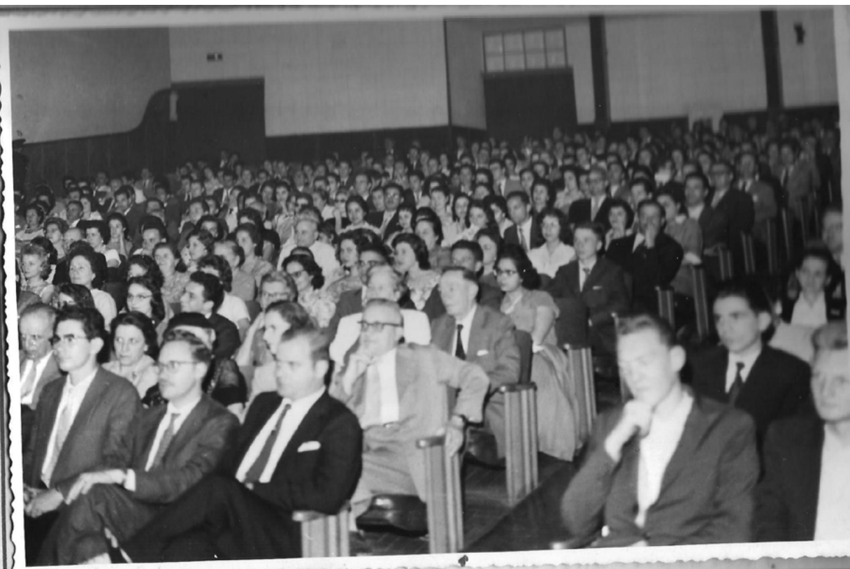
Fig. 1 - Casa cheia no Teatro Arthur Azevedo, em São Paulo, em agosto de 1958, na peça Week end , com direção de Antonio Ghigonetto.