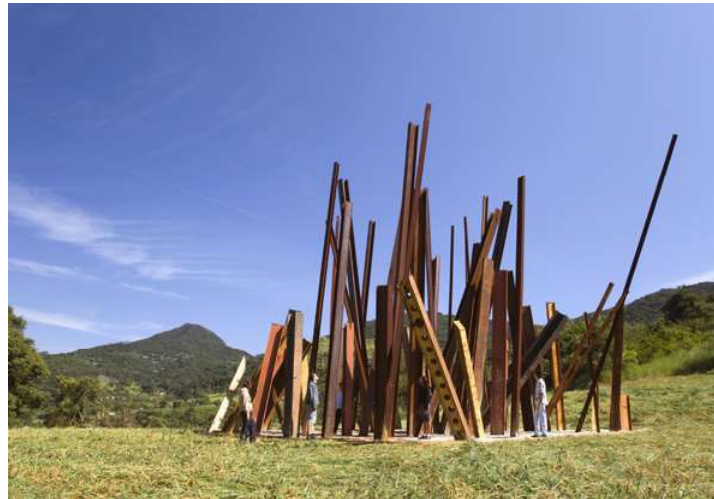
Figura 1 - Beam Drop , Inhotim, 2008. Chris Burden.

Instalação : Cimento fresco e 71 vigas de metal