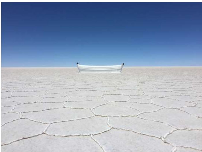
Figura 2 - Estudo para o Tempo Suspenso 間, 2016. Dudu Tsuda

Vídeo instalação / obra derivada de Performance site specific para espaço público que lida com a sensação de tempo suspenso a partir do conceito Japonês de Ma “間”. Foto: Alejandra Sánchez Fonte: http://dudutsuda.com/artworks/?p=386 . Acesso: 08 de abr. 2020.